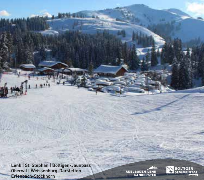
Lenk | St. Stephan | Boltigen-Jaunpass Oberwil | Weissenburg-Därstetten Erlenbach-Stockhorn